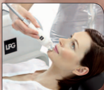
Contouren van de lippen