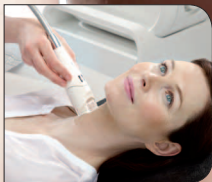
Hals en décolleté