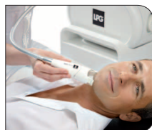
Omtrek van het gezicht

Snel, doeltreffend, zonder toevoeging van overbodige cosmetica en zonder omkleden.